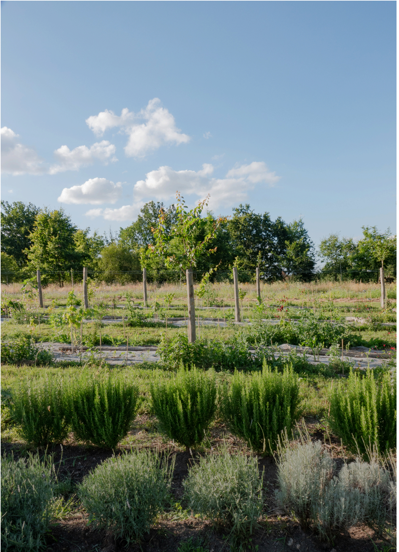
En couverture - Illustration © Sophie Rivière pour Les Enracinées